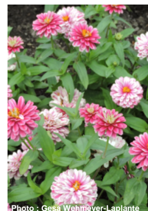
Zinnia Zahara double Raspberry Ripple