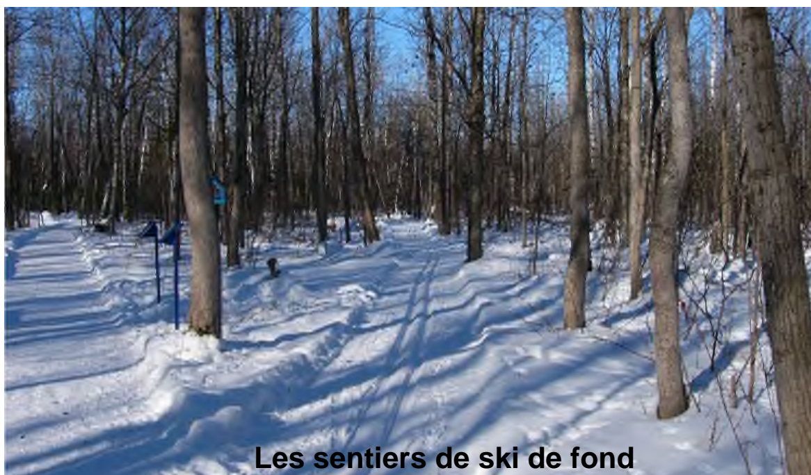
Les sentiers de ski de fond